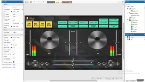
Gambar 1 Pengembangan Aplikasi dengan Construct 3

Bagian layout berinteraksi langsung dengan pengguna melalui aktifitas input touch pada area objek pada layout , kemudia pada bagian event sheet akan merespon apa yang diinputkan oleh pengguna.