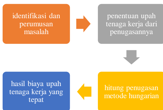
Gambar 2 Langkah Penelitian.

Dalam pemberian tugas kepada tenaga kerja di PT. Hana Text dengan tahapan yang harus dilaksanakan untuk memastikan mencapai hasil yang maskimal. Tahapan dari prosedur penelitian pertama dengan mengidentifikasi dan merumuskan masalah yang menjadi tujuan dari penelitian ini, dengan mengisi upah tenaga kerja berdasarkan penugasannya. Adapun langkah penelitian adalah sebagai berikut: