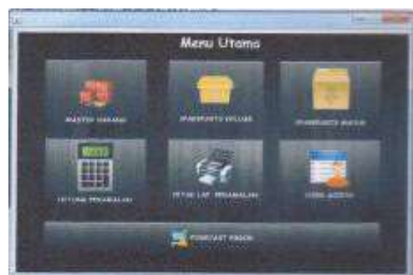
Gambar 1. Tampilan Menu Utama

Setelah melalui tahapan pengembangan sistem, maka didapatkan sebuah sistem yang siap untuk digunakan. Berikut ini adalah hasil dari sistem yang telah dibuat beserta pembahasannya.