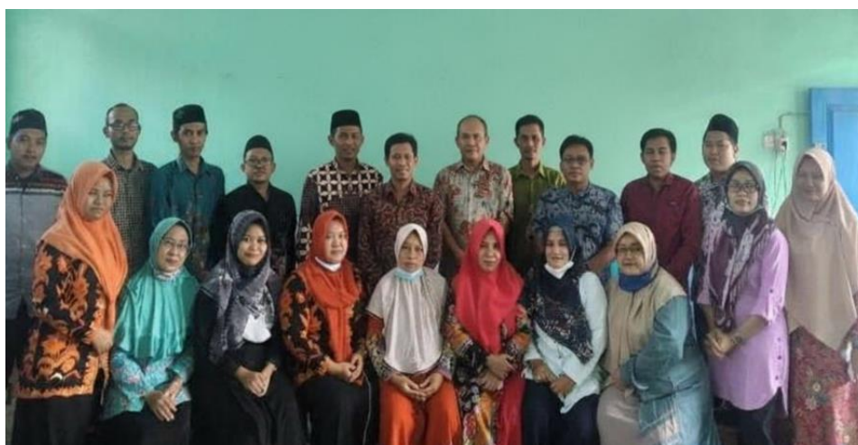
Gambar 3. Bukti Partisipasi Guru dalam Pemanfaatan Aplikasi CMS WordPress sebagai media web.

Pelatihan menunjukkan peningkatan yang konsisten di seluruh peserta. Rata-rata nilai pre-test sebesar 48,5 meningkat menjadi 83,6 pada post-test. Rata-rata nilai Gain =35,1 (SD=1,6), artinya kemampuan para guru setelah pelatihan meningkat 35 point dari kemampuan awalnya dan variasi antar guru kecil (SD rendah menunjukkan peningkatan terjadi secara merata).